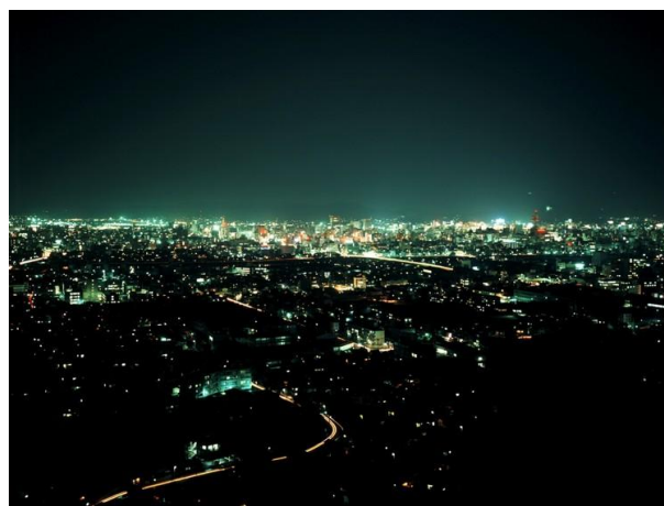
从酒店欣赏到的冈山夜景

京都大仓饭店是京都第一家高达 60 公尺，古都街景与连绵群山尽收眼底的都会型度假饭店。